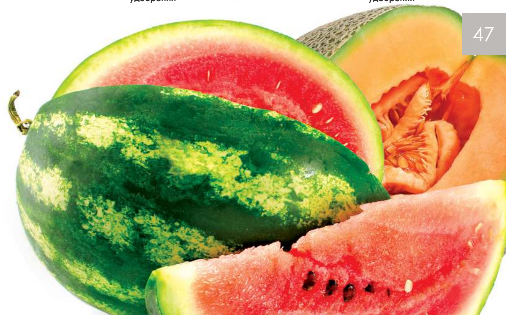
Программа листовых подкормок арбуза, выращиваемого в открытом грунте